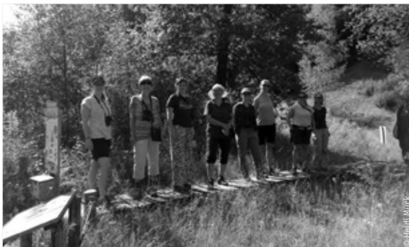
Social Event 2022: Besuch des Naturlehrgebiets Ettiswil