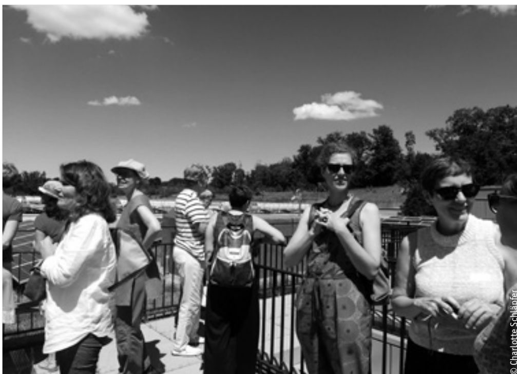
Führung durch Green City in Zürich

L'an passé a également été incertain. Même si les mesures de protection dues à la pandémie ont été levées et que la Suisse est revenue à une « situation normale », l'invasion russe en Ukraine et la crise climatique et énergétique ont dominé l'actualité. Au milieu de toutes ces turbulences, au quotidien, il s'avère que les besoins des membres restent au centre des préoccupations des ffu-pee. Des rencontres plus petites mais pertinentes ont été organisées, de nouveaux cours de langues ainsi qu'un programme de mentorat ont débuté. De nombreuses activités ont de plus eu lieu du côté de la communication. L'Antenne Romande dispose d'un nouveau flyer et le renouvellement du site Internet est en cours.