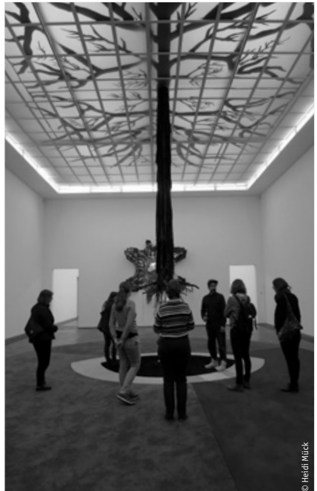
Regionalgruppe Basel in der Kunsthalle Basel

En collaboration avec l'Association Suisse des Femmes Ingénieures ASFI, les ffu-pee vont réaliser le projet « Guide de culture environnement ». Il a pour but de soutenir les Femmes MINT dans la branche environnementale et de sensibiliser les directions des entreprises participantes aux questions de l'égalité comme d'initier des premières mesures permettant des changements dans la culture de ces organismes. Le Guide de culture environnement s'inspire du guide de l'ASFI qui rencontre un grand succès. Un préprojet a clarifié l'an dernier de quelle manière le programme pouvait être adapté aux plus petites structures qu'on trouve dans le secteur environnemental.