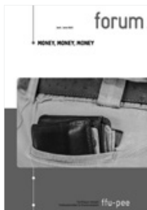
2/2022: Money, Money, Money