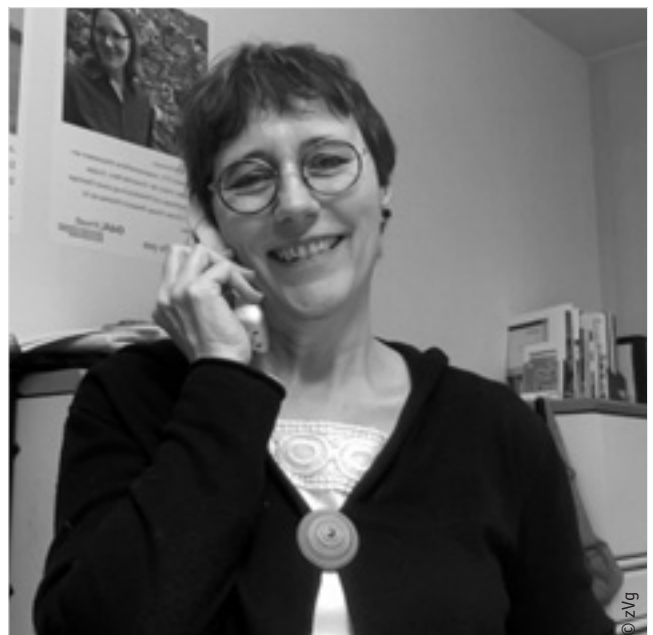
Geschäftsleitung im Dialog mit den Mitgliedern

Die bewährte Zusammenarbeit mit den SVIN (Schweizerische Vereinigung der Ingenieurinnen), dem Netzwerk frau+sia (Schweizerischer Ingenieur- und Architektinnenverein) und NEWI (Netzwerk der Wasseringenieurinnen) im Bereich der Weiterbildungen lief im Berichtsjahr weiter. Auch mit der Bildungsinstitution sanu future learning ag wurde die langjährige Kooperation weitergeführt. Die ffu-pee patronierten zahlreiche Kurse und Ausbildungsgänge der sanu, für die die FachFrauen einen Rabatt von 20% erhielten. Da im 2021 sehr viele Mitglieder patronierte Kurse besuchten, wurde das Kostendach der ffu-pee für dieses Angebot erhöht. Die versuchsweise Zusammenarbeit mit Pusch (Praktischer Umweltschutz) bei ausgesuchten Kursen und Tagungen mit einem Frauenanteil von mindestens 30% bei den Referierenden und Moderierenden war erfolgreich. Pusch berichtete von markant gestiegenen Frauenanteilen bei manchen Tagungen. Um diese Zusammenarbeit zu klären und zu festigen wurde eine gemeinsame Vereinbarung abgeschlos-