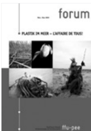
1/2022: Plastik im Meer . L'affaire de tous!

La rédaction s'est pourtant retrouvée dans une situation difficile. Avec le recul, on voit qu'elle l'était déjà depuis un moment. Au milieu de l'année 2021, plusieurs rédactrices ont démissionné alors que des nouvelles sont arrivées. Les raisons sont diverses, mais il est devenu de plus en plus ardu de réunir assez de volontaires pour effectuer le travail de rédaction. En 2023, il y aura donc du changement. La responsabilité de « forum » fera l'objet d'un mandat et l'équipe de rédaction qui travaillait jusqu'ici de manière bénévole sera dissoute.